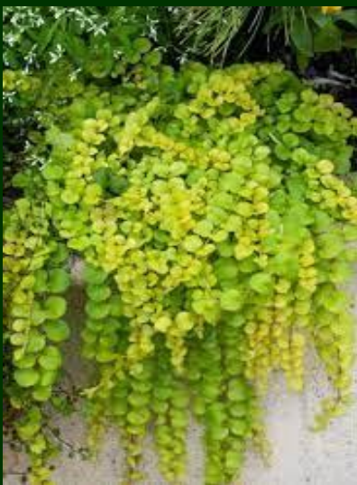
Lysimachia (planten terras)