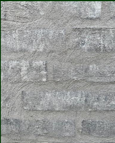
Grijze baksteen, gechipperd

De gevelmaterialen van voor-en achtergevel zijn wit-lichtgrijs gekaleide ('gechipperde') baksteen, in combinatie met decoratief zichtbeton en donkerbruin-grijs aluminium buitenschrijnwerk. Deze materialen zullen een warme, zachte en tevens authentieke uitstraling verlenen aan het gebouw.